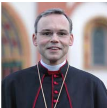
S.E. Bischof Tebartz- van Elst, Bischof des Bistums Limburg

Wir freuen uns, dass wir als Referenten zwei exponierte Vertreter aus Kirche und Wirtschaft gewinnen konnten: