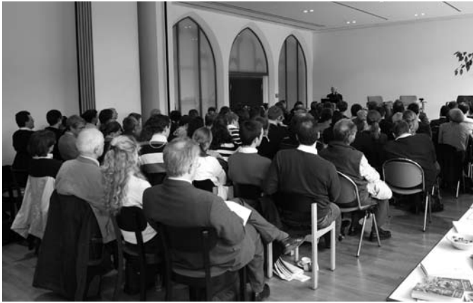
„Volles Haus“ beim Workshop der Generation Benedikt in Bonn.